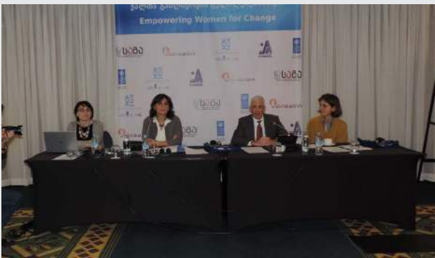
(დაწვრილებით ტრენინგების და სემინარების თემატიკა და სტატისტიკა იხ. დანართში №4),