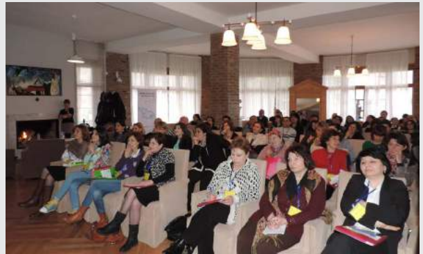
(More details on the training and seminar topics and statistics is available in Annex №4),